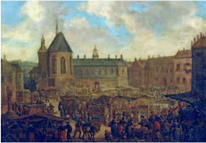
Een markt in de zeventiende eeuw. Op de verbodiging prijst een kwakzalver zijn middelen aan.

dinsdag in veel andere Meierijsche buurtschappen markten plaatsvonden. Vandaar dat het Helmondse stadsbestuur aan de Raad van Brabant verzocht, de weekmarkt voortaan op zaterdag te mogen houden. Nadat bij de raad en schepenen van 's-Hertogenbosch advies was ingewonnen, werd het voorstel op 23 augustus 1538 door Keizer Karel V geautoriseerd.