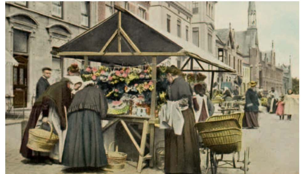
Marktdag omtrent 1905, de Markt gezien in de richting van de Marktstraat. Midden op de foto het witte huis van Van Vlissingen-Ramaer. De toren in van het klooster Sint Aloysius.

Israëlieten. De vaste marktdagen waren toen de vrijdag voor de laatste dag in mei en de eerste vrijdagen na 24 juni, 1 september en 25 november. De jaarmarkten raakten echter zo in verval dat ze niet meer te onderscheiden waren van de gewone weekmarkten. De wekelijkse marktdag werd vanaf 3 juni 1809 op last van de Landrost van Brabant eveneens op vrijdag gehouden. Dit was een eis van Koning Lodewijk, waarschijnlijk ter wille van de sabbat vierende joden. Enkele maanden later, na de troonafstand van Lodewijk, werd de weekmarkt definitief naar de zaterdag verplaatst. Na de aanleg van de Zuid-Willemsvaart in 1825, bloeide de weekmarkt weer helemaal op.