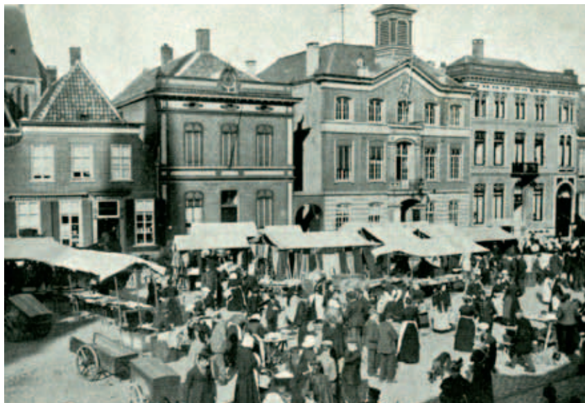
Marktkraampjes en belangstellenden tijdens de zaterdagse weekmarkt omstreeks 1901. Op de achtergrond het stadhuis en het herenhuis van Willem Prinzen.

In de tijd van koning Lodewijk werden de vier Helmondse jaarmarkten op vrijdag gehouden, als een gunst aan de