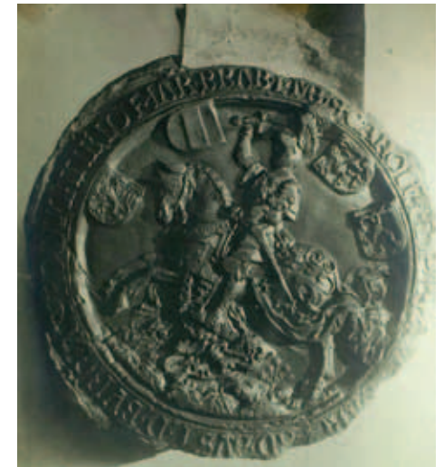
Zegel van keizer Karel V hangende aan een charter betreffende de Helmondse weekmarkt.

rige markt in de omgeving, méér handel werd bedreven dan op tien markten in Helmond: “Sulx dat bevonden wordt ’t gras op ’t Merckt bijnnen Helmont oock te