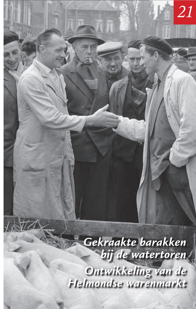
Gekraakte barakken bij de watertoren Ontwikkeling van de Helmondse warenmarkt