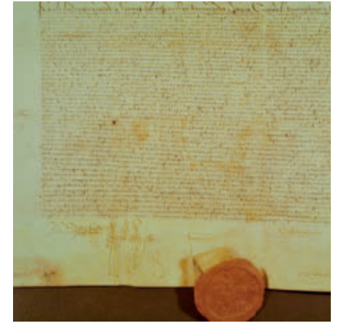
Akte uit 1538 waarbij keizer Karel V de weekmarkt van dinsdag naar zaterdag verzet. (Collectie RHCE fotograaf onbekend).

Aan het eind van de tachtigjarige oorlog was de stad, mede door de pest die in 1636 in alle hevigheid woedde, vrijwel neringloos geworden. Op de markt werd nagenoeg niets meer omgezet. In een akte staat geschreven dat op één willekeu-