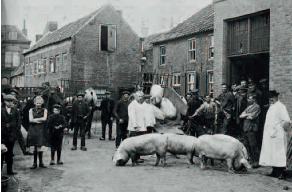
De varkensmarkt in 1916 aan de Kamstraat met slagerij Helsper aan de Wiel. Op de achtergrond de voormalige fabrieksschool van Van Vlissingen, eerder de Wilhelminaschool.

gebruikt mocht worden. De tegenwoordige vleeskeuring richt zich vooral op hygiëne, voorschriften voor slachterijen, opslag en vervoer van vers vlees. In schril contrast vond de keuring destijds gewoon in de openlucht plaats. Na de schouwing werden de beesten door een van de Helmondse slagerees mee naar huis genomen om daar te worden geslacht.