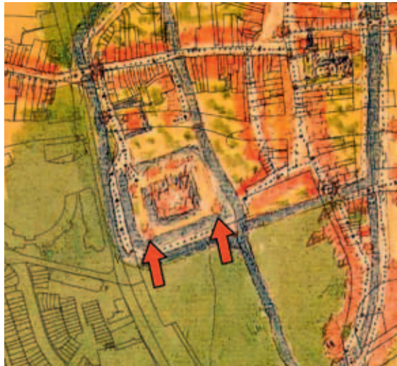
Kaartje van Helmond omstreeks 1560. Met de pijlen worden de twee artillerietorens, die tussen de kasteelgracht en de buitengracht stonden, aangegeven.

Opmerkelijk zijn enkele fragmenten van aardewerk uit Zuid-Limburg en Elmpst, een spinsteentje uit Elmpst en een scherf protonsteengoed, met datering tussen 1050 en 1350 na Christus.